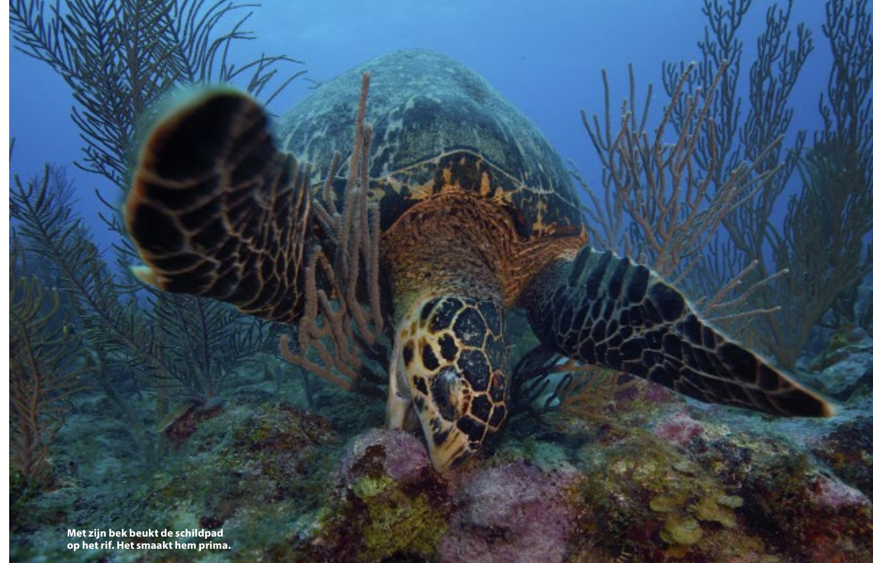
Met zijn bek beukt de schildpad op het rif. Het smaakt hem prima.

's Ochtends worden we wakker van het zachte geruis van de zee. We hebben het vasteland verruild voor het eiland Ambergris Caye (Caye is een klein laag eiland, dat uit zand of koraal bestaat). Onze eigen beach house staat direct aan het strand en kolibries scheren voorbij. Vanaf onze veranda hebben schitterend uitzicht op de spiegelgladde zee, waar we onze 'taxi' al aan zien komen. Voor onze duikdag hoeven we namelijk niet ver te lopen: we worden opgepikt op de pier van ons resort. Onze eerste duik maken we bij de Toffee Canyons. De boot is nog maar net onderweg of we zijn er al. Het rif bij Ambergris Caye staat bekend om de eenvoudige omstandigheden, canyons, swim-throughs, koraaltuinen, vele sponzen en zicht dat kan oplopen tot 46 meter. Dankzij de vaste boeien langs dit deel van het barrièrerif hoeft er nergens met ankers gesmeten te worden. Ik heb nog maar net mijn hoofd onder water gestoken of ik zie al een verpleegsterhaai! Hij ligt lekker te snurken onder een kleine overhang op de zandbodem. Twee meter verderop ligt er nog eentje te dutten. Op 10 meter diepte