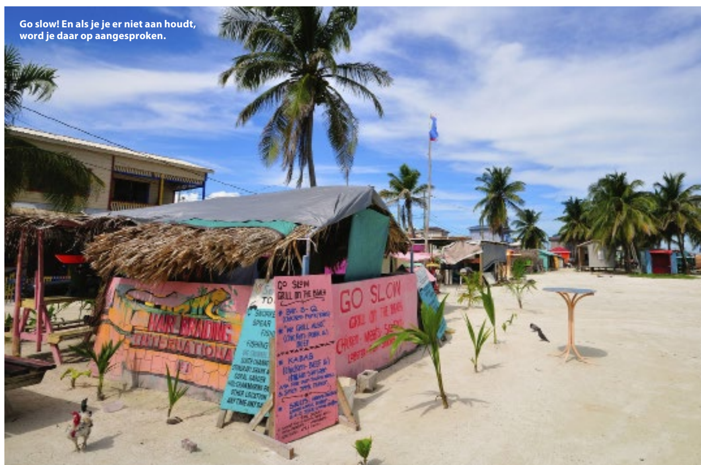
Go slow! En als je je er niet aan houdt, word je daar op aangesproken.