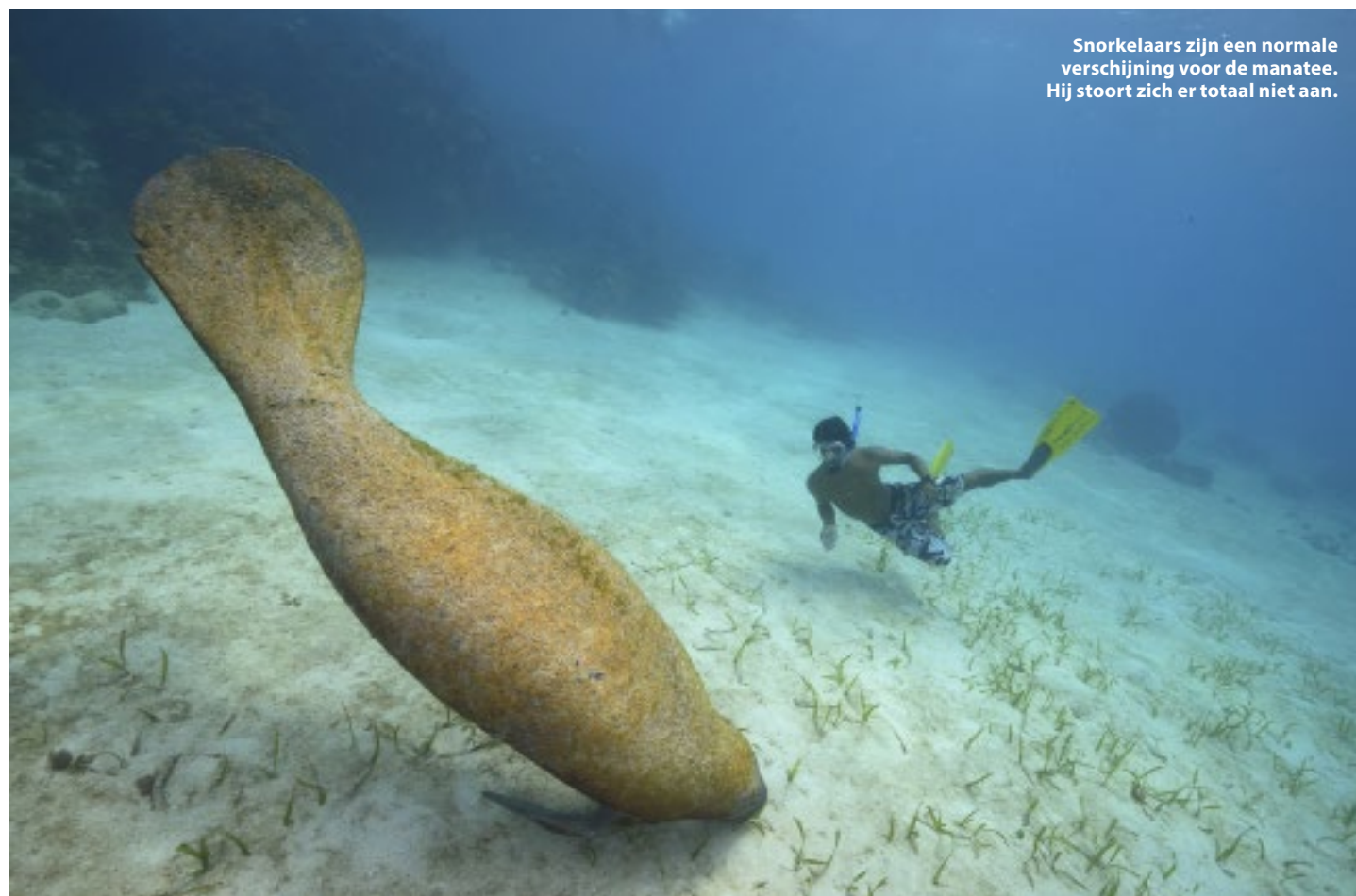
Snorkelaars zijn een normale verschijning voor de manatee. Hij stoort zich er totaal niet aan.