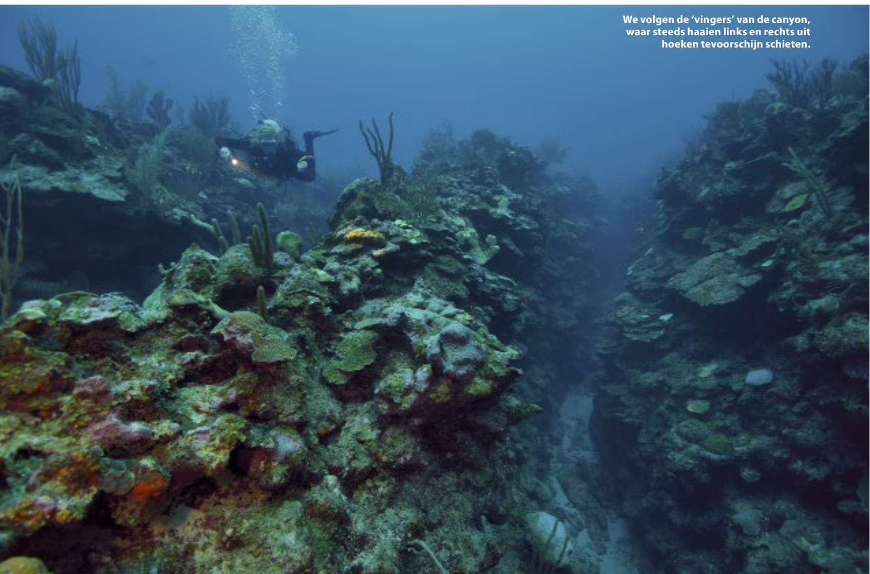
We volgen de 'vingers' van de canyon, waar steeds haaien links en rechts uit hoeken tevoorschijn schieten.